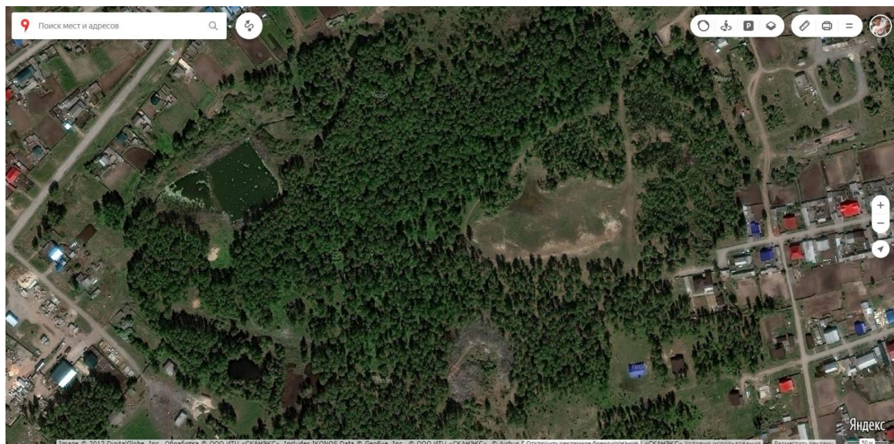
Схема маршрута похода (Приложение 1) Условные обозначения: